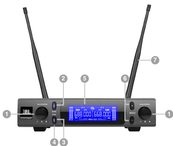
SR300 - 正面

1. 音量旋钮 (A/B) ：用于解锁/锁定SR300、调节通道音量、设置通道参数等。