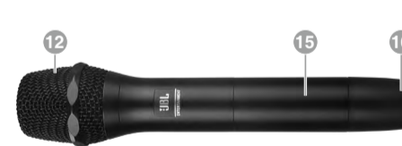
HT300 - 背面

14. 电源开关 ：长按该开关，可开启或关闭HT300。该开关还可用于开启或关闭HT300的自动静音功能。