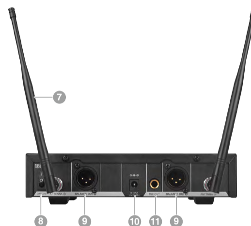
SR300 - 背面

6. 模组按钮 ：仅在SR300解锁时有效，用于选择AB通道的预设频率/频道模组。